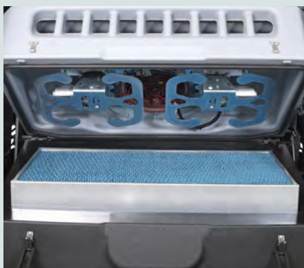
Tidsinnstilt multifrekvent filterrister sikrer effektiv renging av filteret.