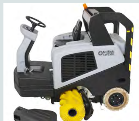
Rask og enkel utskifting av de viktigste komponentene, letter den daglige driften og reduserer nedetiden.