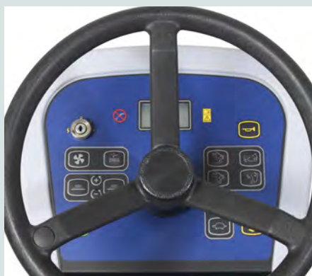
Betjeningspanel med ikon-knapper og display gir god brukervennlighet.